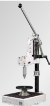
SPIROL Modelo PM Máquina de fijación manual

Casquillos para pasadores en el montaje del cuerpo de la transmisión