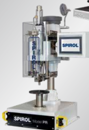
SPIROL Modelo PR Máquina de fijación semiautomática